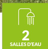
Photo non contractuelle - Fauteuils et accessoires en option.

Composé de deux modules, le chalet KUBIO de 61m 2 fait une très jolie résidence secondaire (en parc résidentiel ou camping). Dans sa version 2 chambres et 2 salles d'eau, son module principal offre un vaste espace de vie, idéal pour recevoir des amis. Très pratique, sa cuisine dispose d'un accès direct à la terrasse grâce à une large baie vitrée trois vantaux. De même, la chambre parentale avec grand placard-penderie et miroir se prolonge directement sur la terrasse.