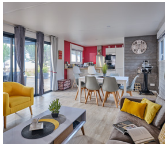
Photo non contractuelle - Fauteuils et accessoires en option.