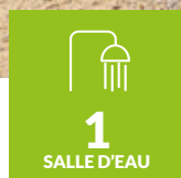
Photo non contractuelle. Porte d'entrée en option.

Le chalet KUBIO de 76 m 2 est composé de deux modules disposés en « L », une configuration qui permet de créer deux espaces distincts pour un habitat facile à vivre. La partie jour, baignée de lumière grâce à la baie vitrée trois vantaux, dispose d'une pièce de vie spacieuse dans laquelle prennent place une grande cuisine, un bel espace salon ainsi qu'un cellier très pratique pour l'électroménager de type lave-linge. La partie nuit, au calme du second module, s'agence en deux ou trois chambres et possède de larges placards pour un bien-être maximum.